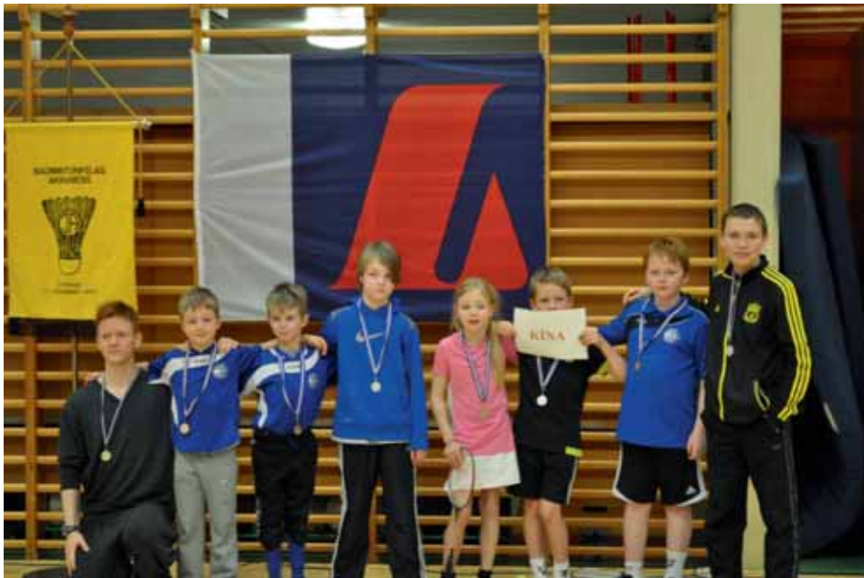
Verðlaunahafar á Grislingamóti.

Iðkendur félagsins tóku þátt í fjölda annarra móta á árinu, bæði unglinga- og fullorðinsmótum og hafa staðið sig mjög vel. Góður árangur hefur náðst, krakkarnir hafa tekið miklum framförum og unnið til fjölda verðlauna á mótunum.