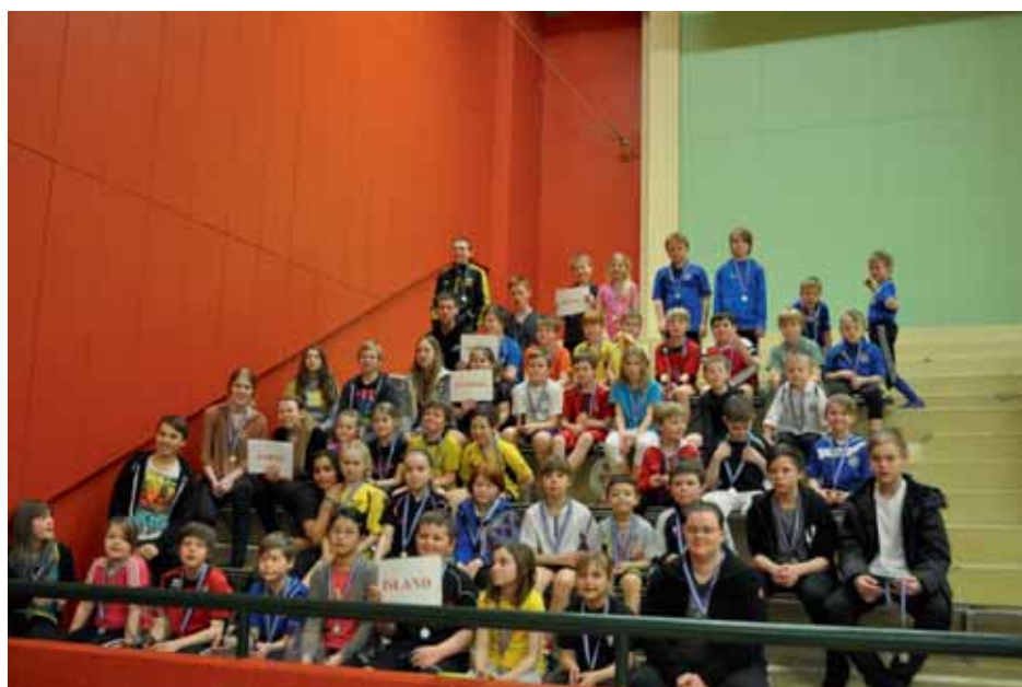
Grislingamótið – glaðir keppendur.